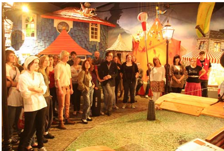
Besök på Junibacken på Introveckan ht -08

Dag 5 var det allmän information, utdelning av böcker m.m.