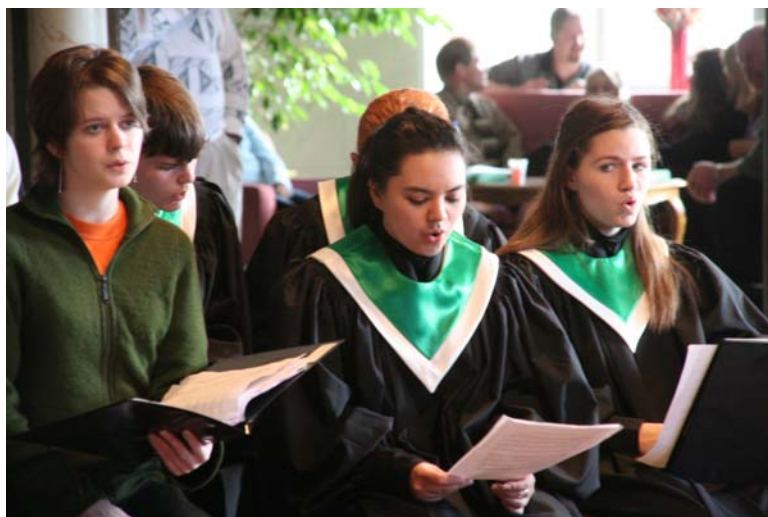
Internationellt samarbete vt 2008 – kör från Palo Verdo i USA besöker Nordiska Musikgymnasiet

För mer detaljerad information om huvudmannens ekonomiska situation under räkenskapsåret 2007-07-01 –2008-06-30 hänvisar vi till bolagets årsredovisning.