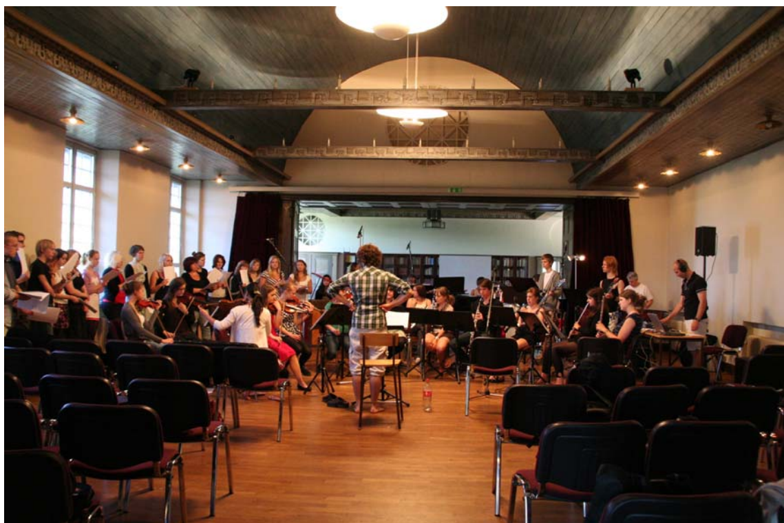
Elevrådets dag juni 2008