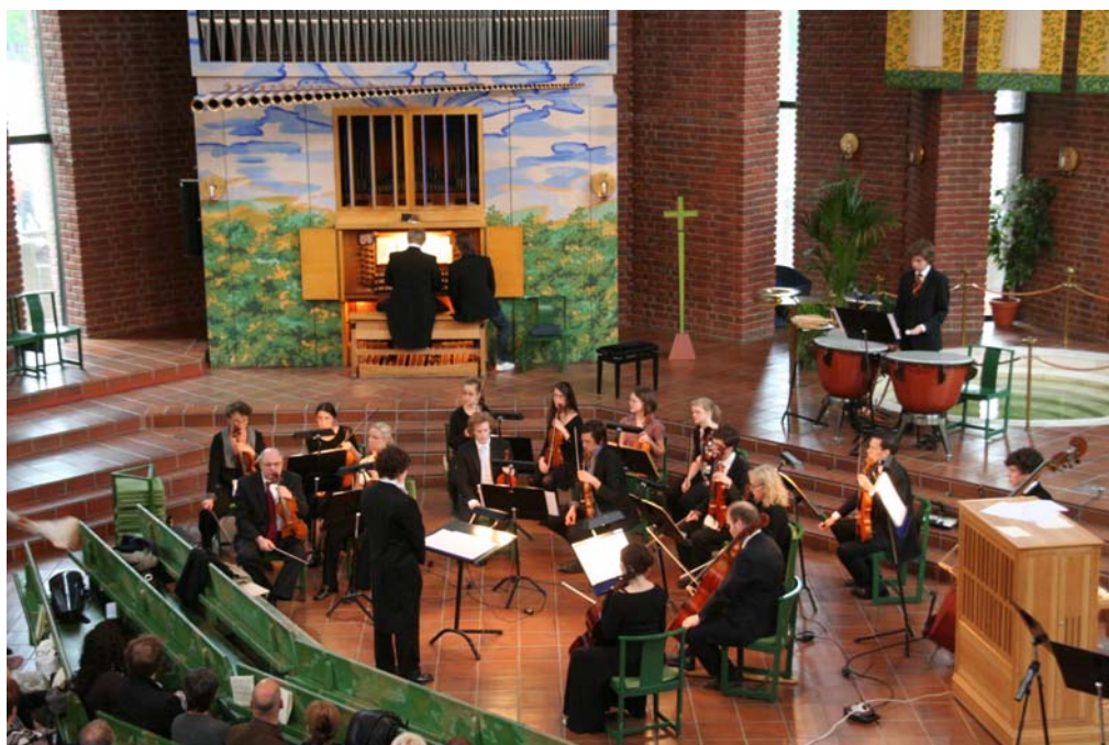
Poulencs orgelkonsert i Immanuelskyrkan 18/5 2008

Den lokala arbetsplanen är på Nordiska Musikgymnasiet ett av de viktigaste redskapen för ett strukturerat utvecklingsarbete. Arbetsplanen finns tillgänglig i en gemensam mentorsmapp i skolans datasystem samt på skolans hemsida och den uppdateras kontinuerligt allteftersom det tillkommer nya avsnitt efter diskussioner inom den pedagogiska gruppen.