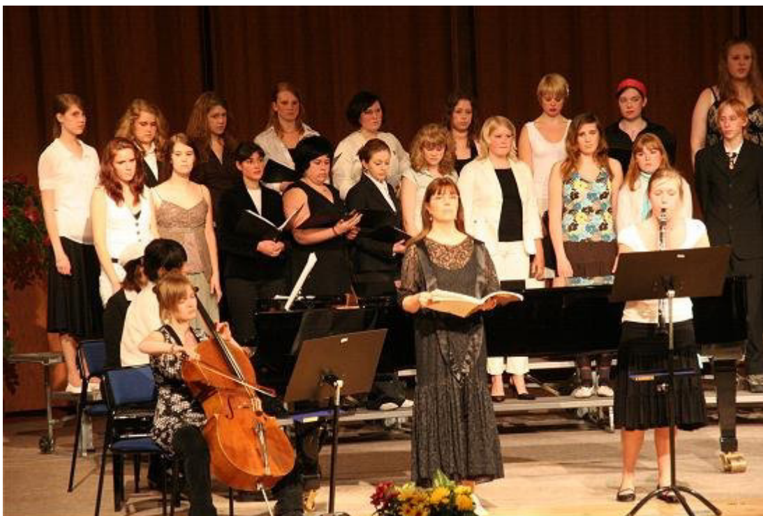
2 juni 2006 - Nordiska Musikgymnasiet ger konsert i Cassels, Grängesberg.