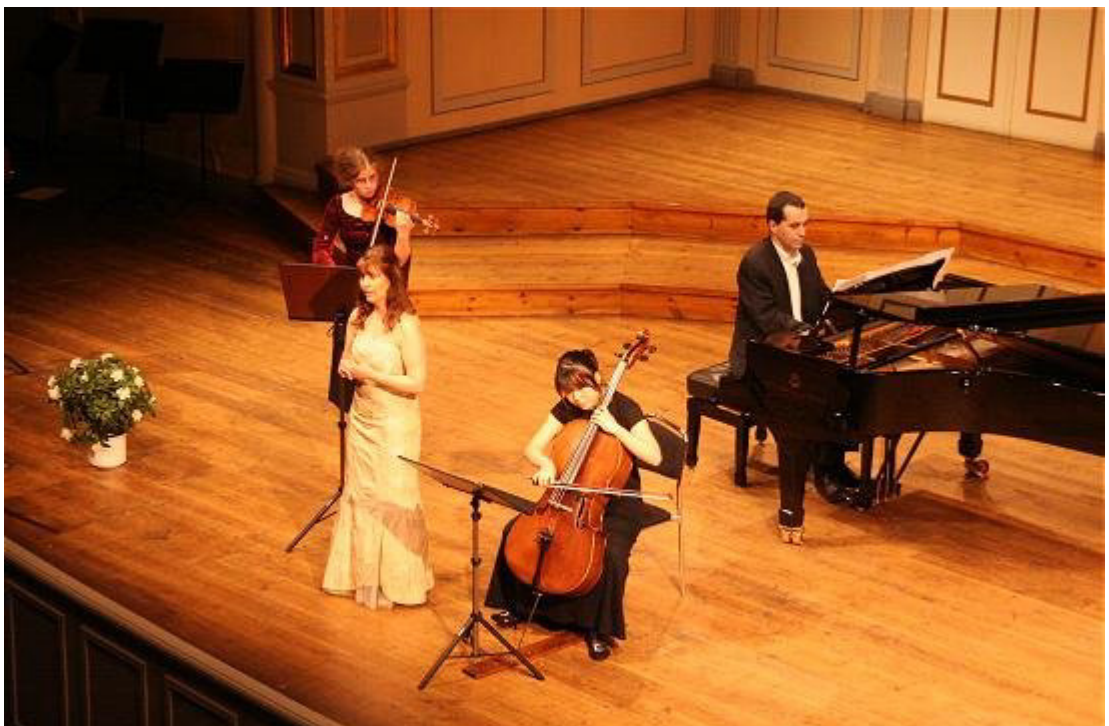
30/4 2006 Nybrokajen 11 – Nordiska Musikgymnasiets jubileumskonsert

Under vt 2006 anordnade vi en stor jubileumskonsert på Nybrokajen 11 då Nordiska Musikgymnasiet firade 5-års jubileum. Vid konserten medverkade även några av våra tidigare elever. Senare under vårterminen genomfördes även en konsertresa till Cassels i Grängesberg.