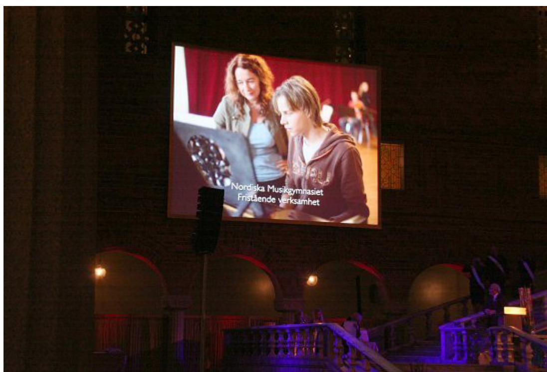
Nordiska Musikgymnasiet – verksamheten nominerad till Stockholms stads kvalitetsutmärkelse 2006

För de elever som vill förbättra sina kunskaper i Engelska och/eller Matematik finns det schemalagda stödtimmar. En timme per vecka finns det även möjlighet till allmänt stöd, s k studieakut. Utöver det finns det även ett allmänt läxstöd (en timme/vecka). Det pedagogiska arbetet beskrivs i skolans lokala arbetsplan (bilaga 1)