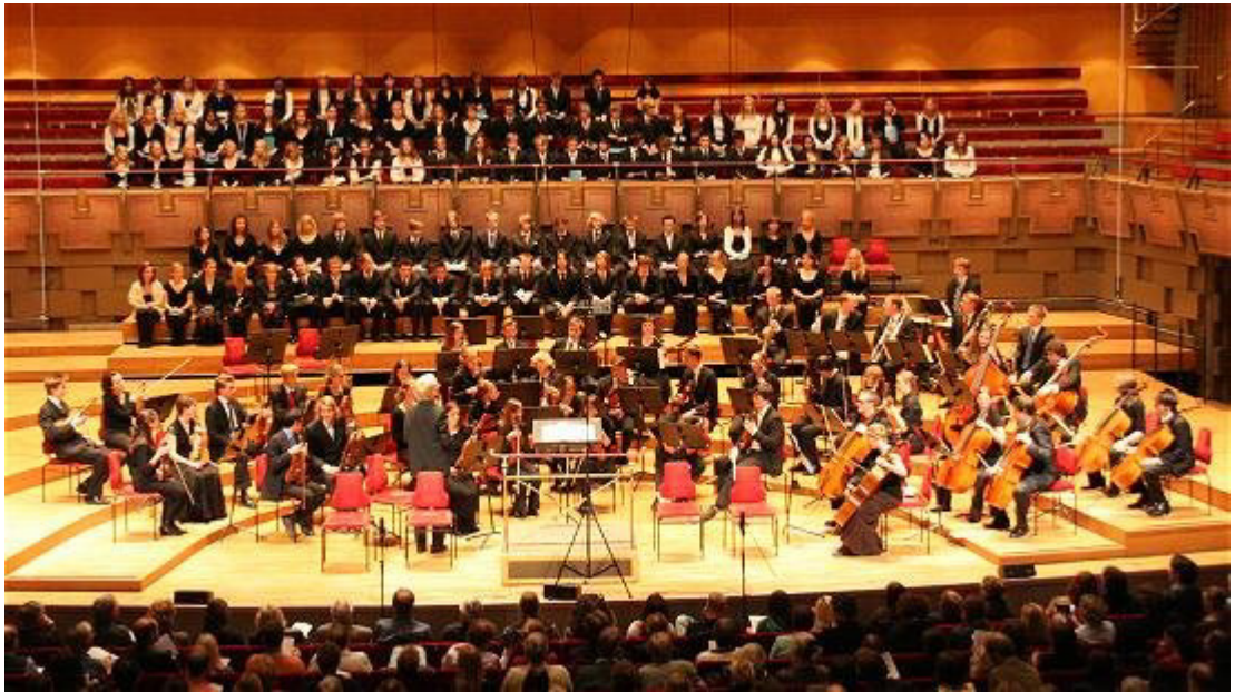
Stockholms Konserthus vt 2006 – samarbetsprojekt med SUSO och Kungsholmens gymnasium

Orkestern har sin bas på Nordiska Musikgymnasiet och elever från vår skola kan, efter prövning, delta i SUSO inom ramen för ensemblespel. SUSO är en av Sveriges ledande ungdomsorkestrar som har en egen konsertserie på Konserthuset i Stockholm. SUSO har vid flera tillfällen regelbundet representerat Sverige i internationella sammanhang, både i och utanför Europa.