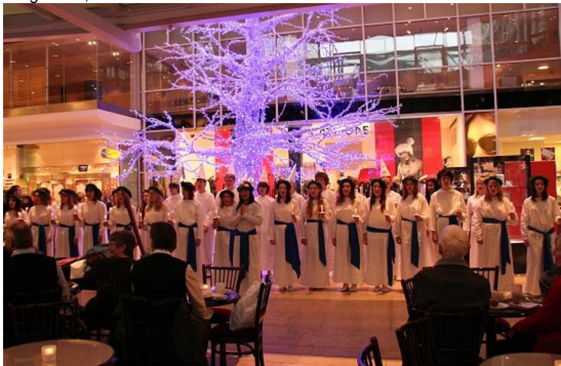
Lucia 2006 i Gallerian

Den pedagogiska gruppen arbetar under schemalagda tider med temadagarnas innehåll för att så småningom presentera det färdiga konceptet för eleverna och föräldrarna (vid föräldramötet). Under 2006 genomförde vi följande temasatsningar: yrkesförberedande temadagar, tema Norden, musikläger på Dragudden, musikvecka.