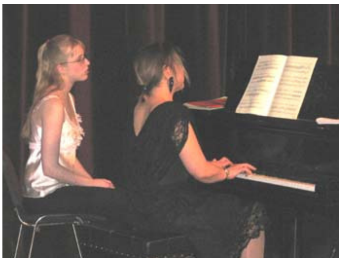
Konsert på Nordiska Musikgymnasiet

Den lokala arbetsplanen är på Nordiska Musikgymnasiet ett av de viktigaste redskapen för ett strukturerat utvecklingsarbete. Arbetsplanen finns tillgänglig i en gemensam mentorsmapp i skolans datasystem och den uppdateras kontinuerligt allteftersom det tillkommer nya avsnitt efter diskussioner inom den pedagogiska gruppen.